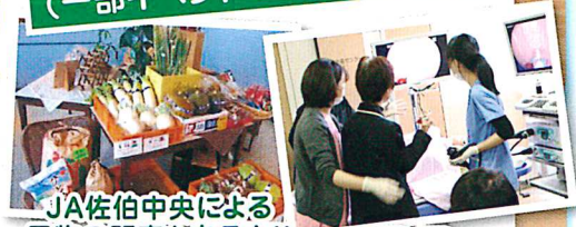
JA佐伯中央による 果物の販売もあるよ!!