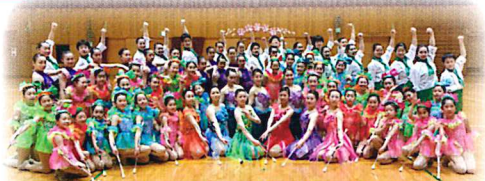
バントワーリング PL広島第一MBA