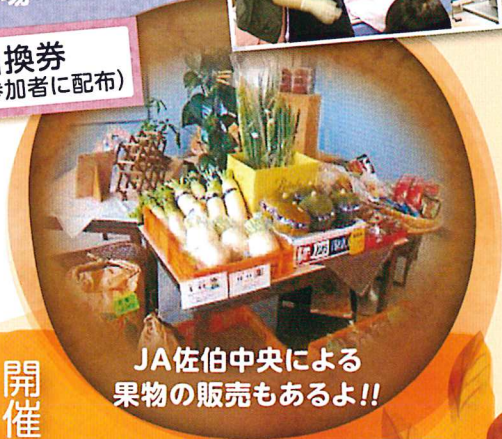
JA佐伯中央による 果物の販売もあるよ!!